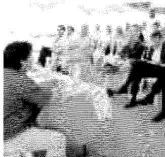
Un momento del convegno