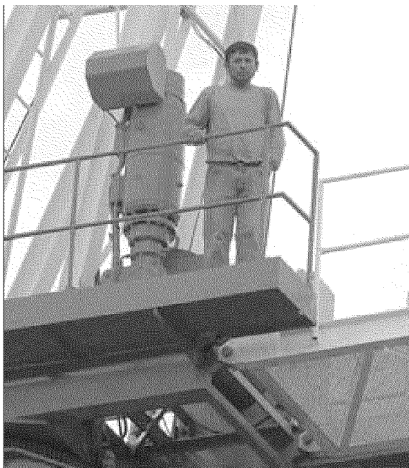
Protesta sulla gru Il 38enne è salito ieri alle 7,30

■ Sul posto la Cgil, i vigili del fuoco e la polizia