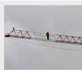
Firenze, Careggi, un uomo minaccia di saltare da una gru

Firenze, 16 giugno 2010 - E' sceso dalla gru, dopo cinque ore e mezzo, l'operaio romeno di 38 anni che questa mattina, intorno alle 7.30, è salito su una gru di un cantiere di viale Pieraccini. L'uomo, che aveva raggiunto i trenta metri di altezza, ha minacciato di buttarsi perché, secondo quanto spiegato da Edmond Velaj della Fillea Cgil di Firenze, non è stato pagato dalla ditta per la quale lavorava.