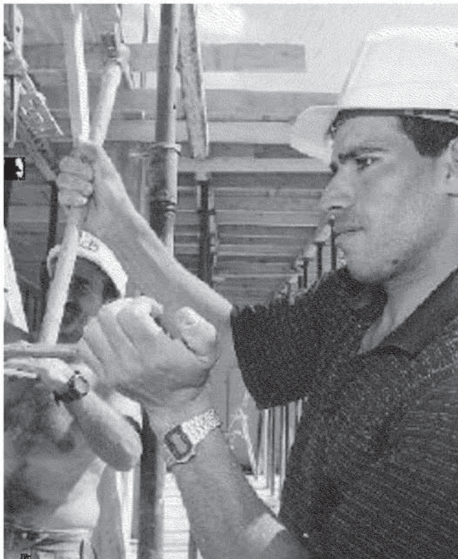
Operai al lavoro sulle impalcature di un cantiere edile