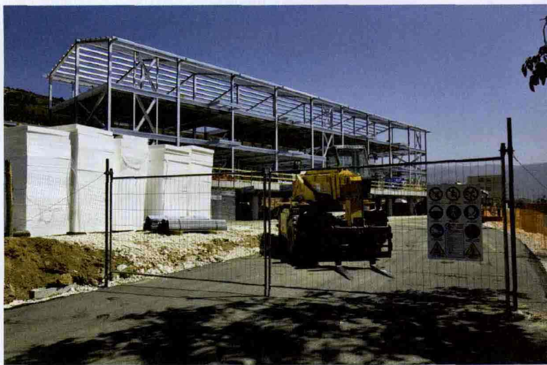
Lavori quasi ultimati a Bazzano

Il sindacato: «Nei cantieri condizioni di lavoro terribili»