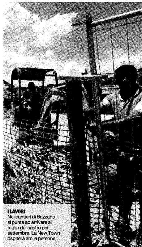
I LAVORI Nel cantiere di Bazzano si punta ad arrivare al taglio del nastro per settembre. La New Town ospiterà 3mila persone