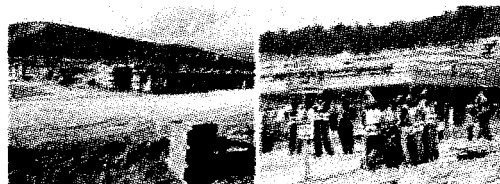
IL COMPLESSO C. A. S. E. L'acronimo vuol dire "complessi antisismici sostenibili ecocompatibili"