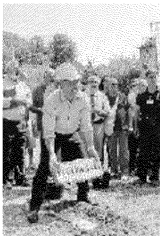
La «posa» della prima pietra