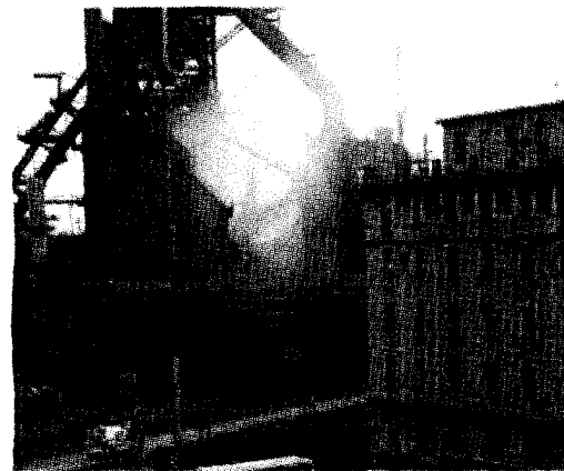
■ Tanti gli incidenti sul lavoro nei cantieri e nelle fabbriche. Nella foto grande le ambulanze e i soccorritori raggiungono il cantiere, teatro dell'infortunio costato la vita a un lavoratore

Da parte dello Stato ci vorrebbe maggiore repressione, con controlli severi e pene certe